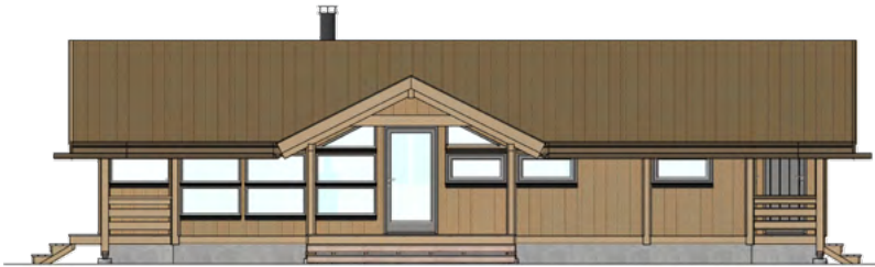
FASADE - SYDVEST