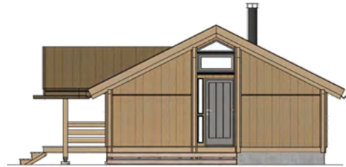
FASADE - SYDØST