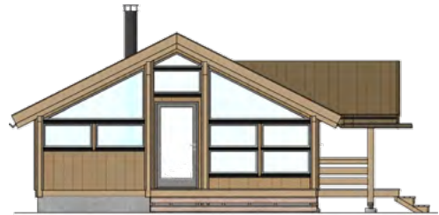
FASADE - NORDVEST