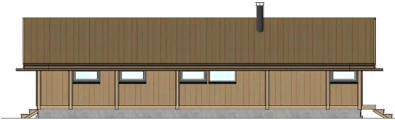
FASADE - NORDØST